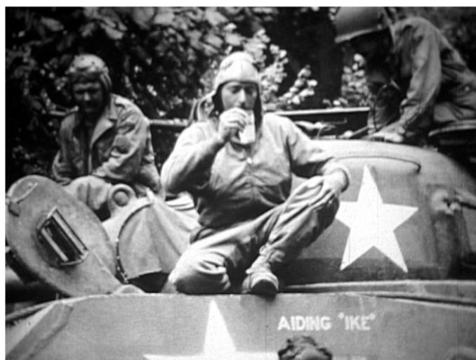
Collection Rouillon, Dourdan, 1944

Collection Cauchoix, Vert-le-Grand, 1944, film 8 mm, NB / Collection Bézard, Saint-Michel-sur-Orge, Paris, 1944-1945, film 9,5 mm, NB (8 min)