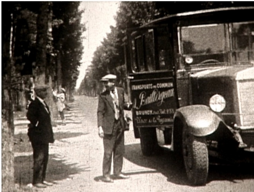
Brunoy, vers 1930