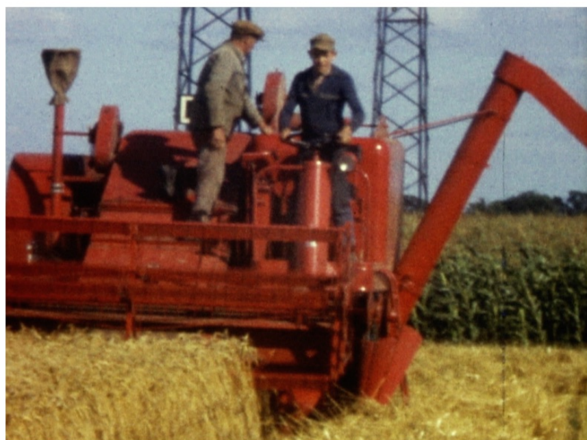
Collection Ronceret, Étampes, vers 1960