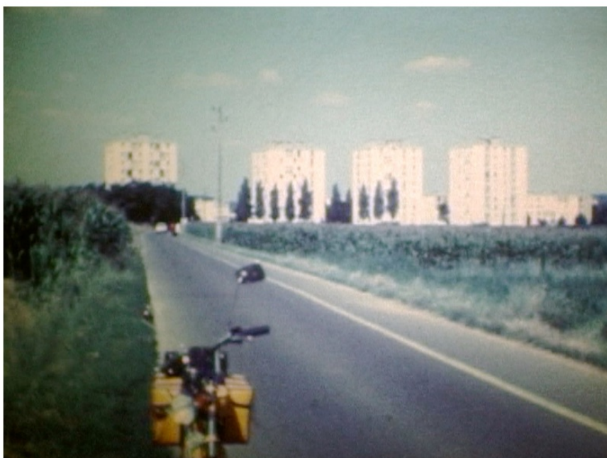
Collection Fiacre, Brétigny-sur-Orge, vers 1974