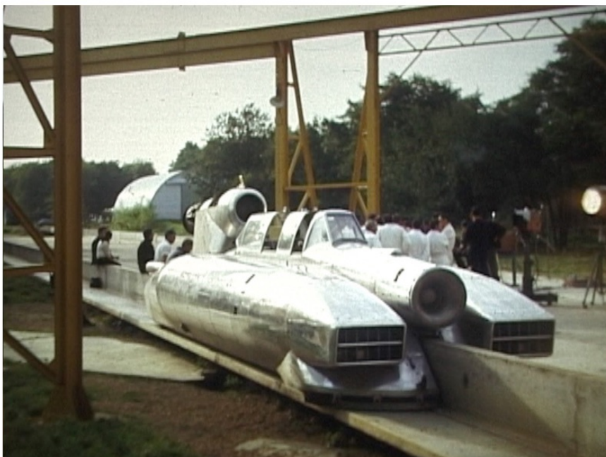
Gometz-la-ville, vers 1968