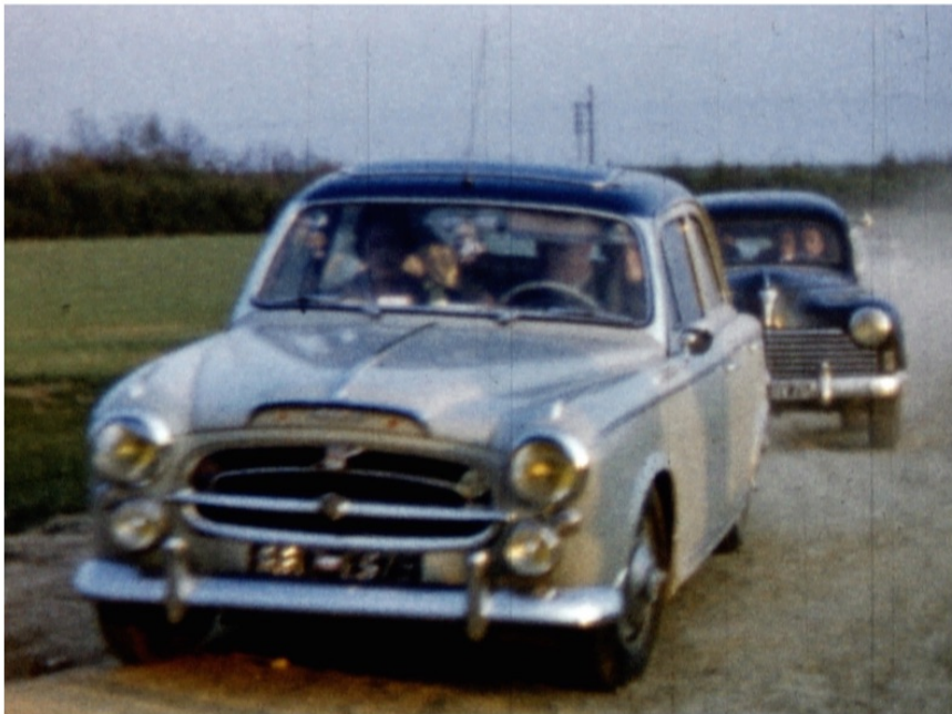
Collection Ronceret, Étampes, vers 1960