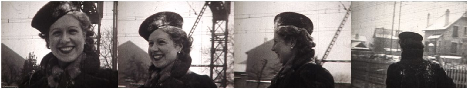
Collection Bézard, Sainte-Geneviève-des-Bois, 1938