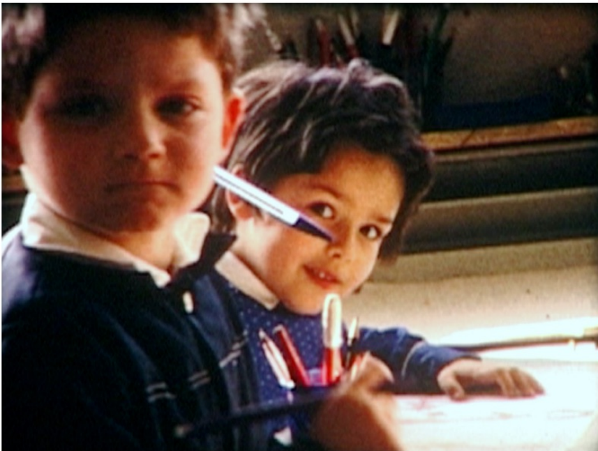
Collection Chauzeix, Saint-Michel-sur-Orge, vers 1970