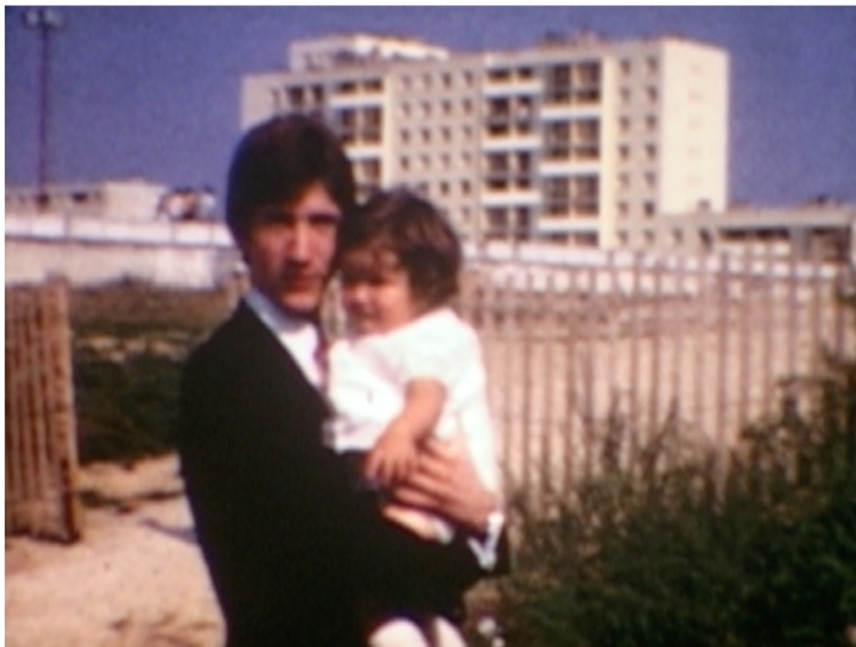
Collection Lacoux, Massy, 1970