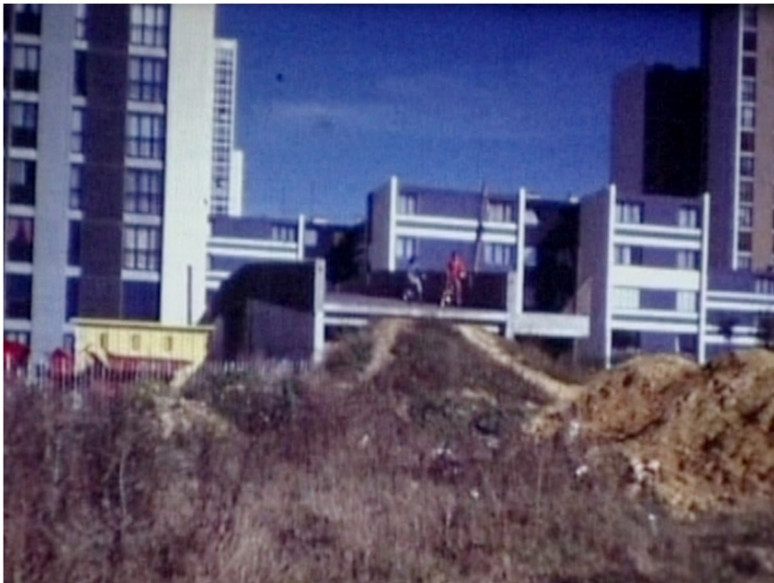
Collection Barraud, Les Ulis, vers 1980