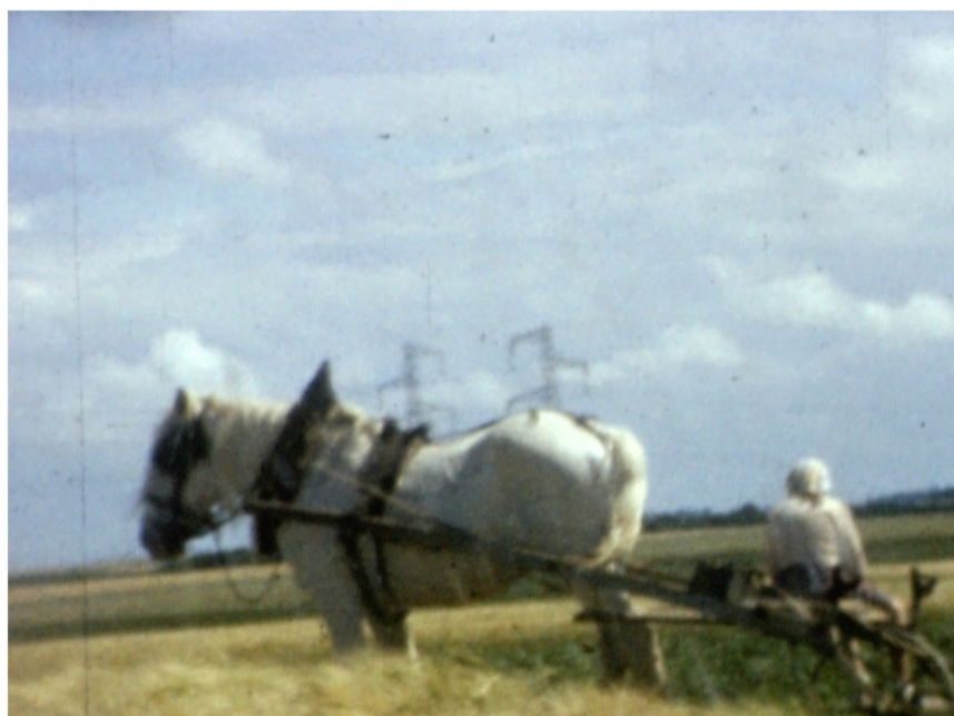
Mérobert, vers 1960