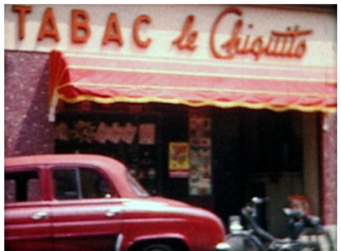
Collection Gilbert, Brétigny-sur-Orge, vers 1966

Collections Club d'Histoire de Saint-Michel-sur-Orge, Barraud, Minssen, Darmagnac, Saint-Michel-sur-Orge, les Ulis, Evry, 1969-1984, film 8 et super 8, couleur (7 min)