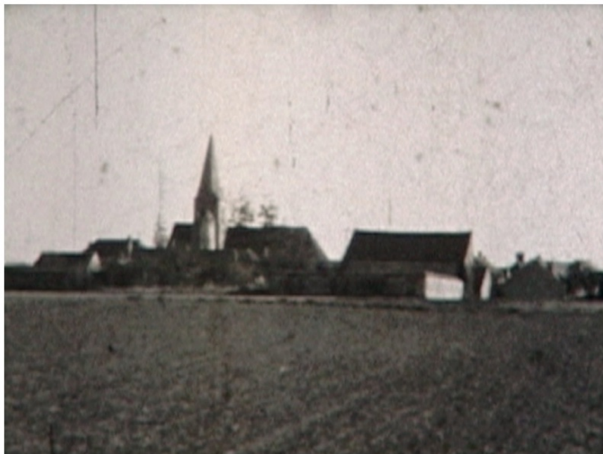
Collection Imbault, Saint-Escobille, vers 1940